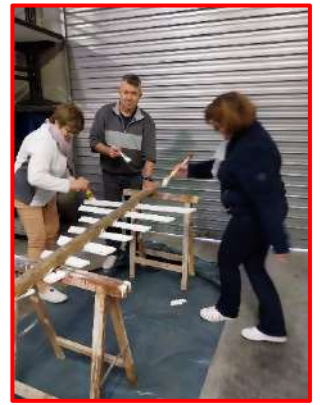
Les lutins du Père Noël au travail ! Ils préparent la décoration de la commune