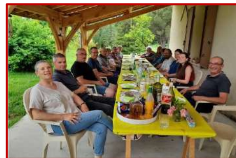
Plusieurs initiatives sur la commune dont une au Colombier pour la Fête des voisins