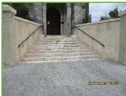
Nettoyage des murs de l'église