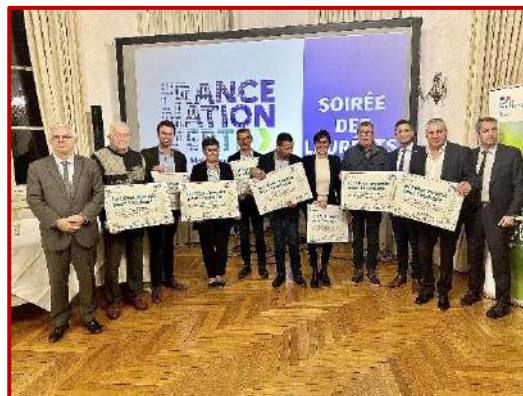
Les autres lauréats départementaux

La commune a été lauréate départementale au Fond Vert pour la rénovation énergétique des bâtiments scolaires.