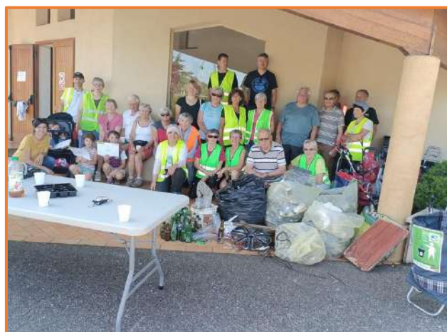
Nouvelle marche écocitoyenne et encore trop de déchets ramassés