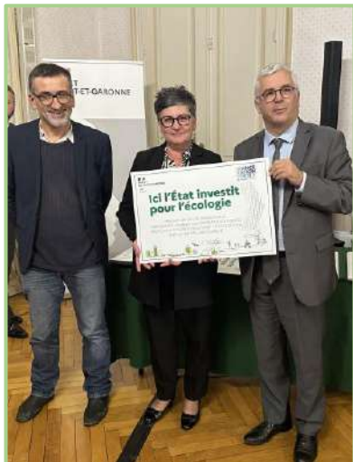
Madame le Maire reçoit le prix des mains de Monsieur le préfet

Le Fond Vert est une subvention de l'Etat qui permet d'accélérer la transition écologique.