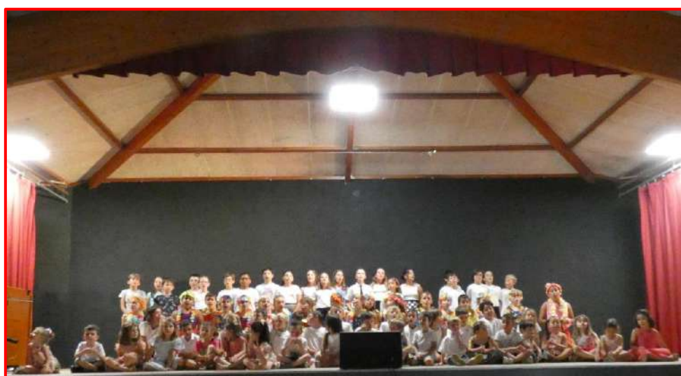
Enfin le retour de la fête de l'école !