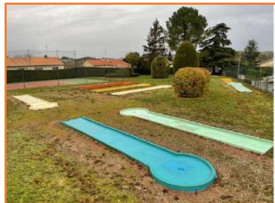
La rénovation du mini-golf est en cours : une 1ère étape ...